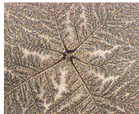
100-fache Vergrößerung der Bildmitte des rhythmisierten Wassers.

«Besonders wertvoll sind Sechsstern-Formen. Auffallend sind die bis in die feinsten Formen sich verzweigenden Sternstrahlen.» (Zitate aus den Untersuchungsergebnissen von Dr. Wilhelm Höfer)