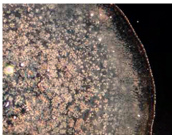
Bio-Olivenöl nach rhythmisierender Behandlung bei 36 Umdrehungen in 30 Sekunden.

Die Speiseöle spielen eine Schlüsselrolle in der Ernährung, aber auch in der Massage und in der Kosmetik kommen sie zum Einsatz. Sie sind oft die Träger von diversen Duft- oder Heilkräutern und damit die Vermittler von Wirkstoffen, ob es Basilikum in der Salatsauce oder Arnika im Massage-Öl sei.